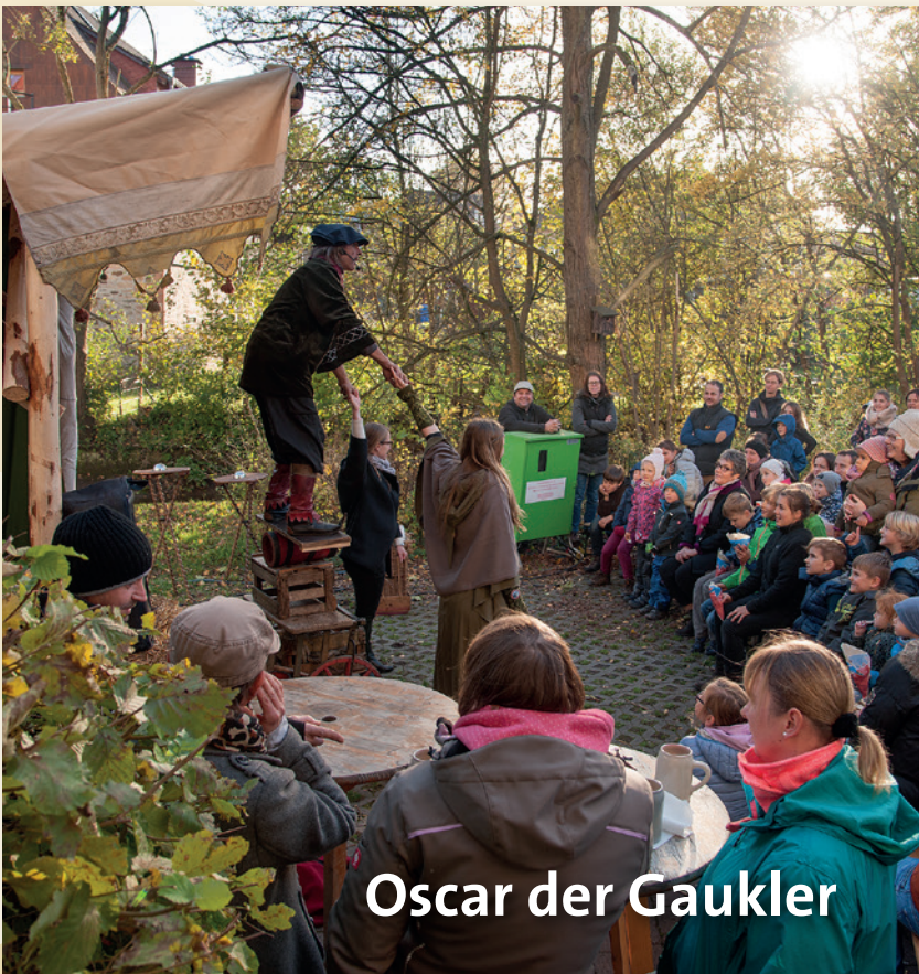
Oscar der Gaukler