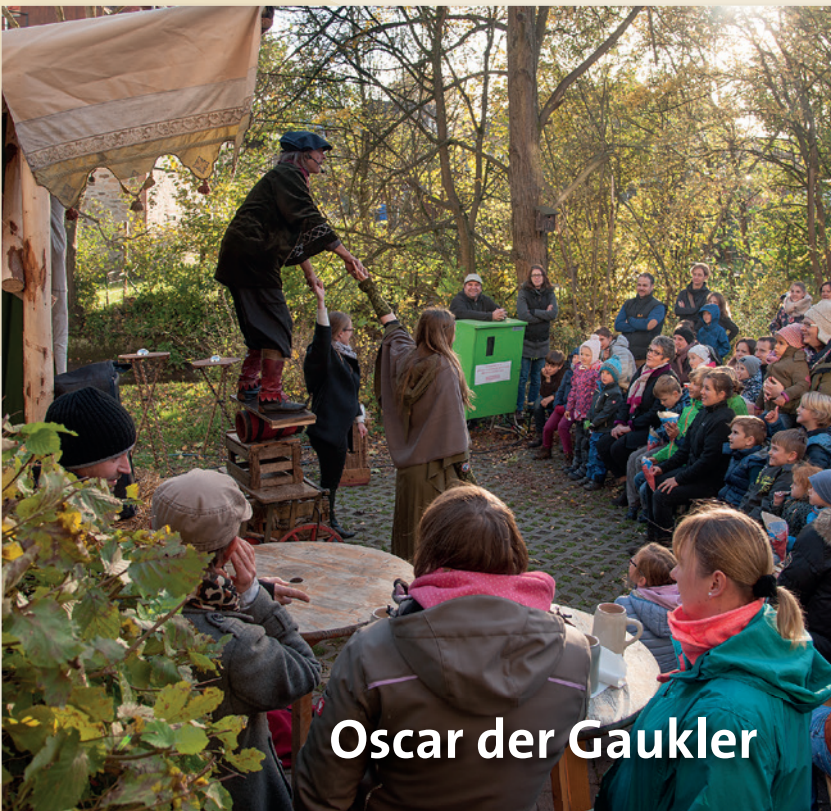
Oscar der Gaukler